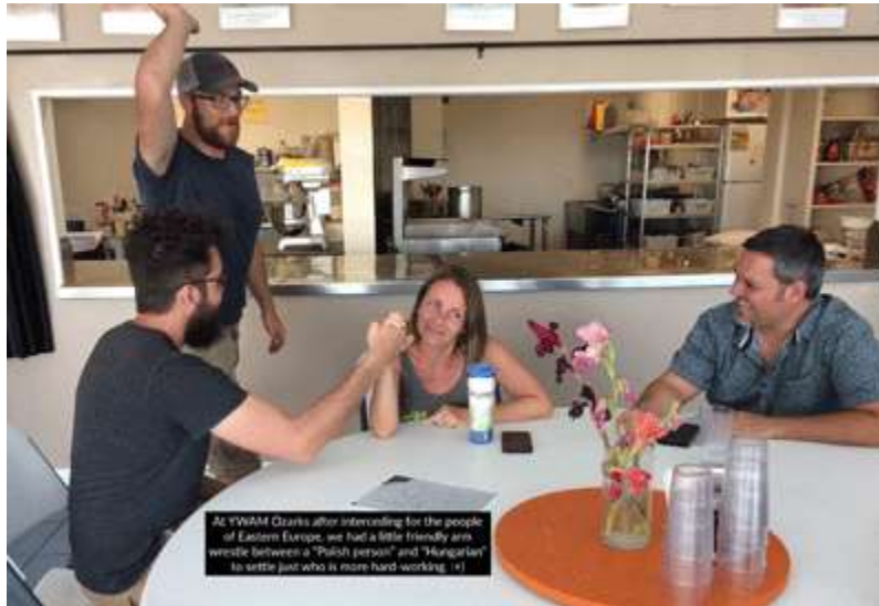
YWAM Ozarks Berdoa untuk Eropa Tengah pada bulan Juli