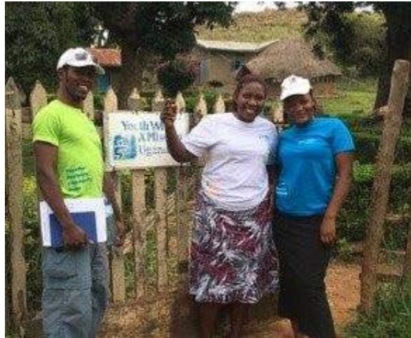
Realizando una encuesta comunitario en la isla de Lingira (Uganda)