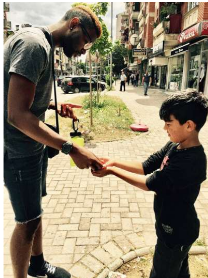
Valor fundamental # 14 – Valora al individuo

Únete a La Invitación en el mes de enero para orar con nosotros sobre estos tres valores. Estas especialmente invitado a orar durante el día especial de oración, enero 10. Si solo tienes un corto momento para orar, te pedimos que reflexiones en estos valores y ores para que los jucumeros tengan un total entendimiento de ellos y para que todas las enseñanzas en JuCUM sean fieles a estos valores. Mientras oras y contemplas estos valores fundamentales, nos gustaría recibir historias de tu parte sobre como estos valores han moldeado tu ministerio o tu vida. Puedes escribirnos a prayer@ywam.org .