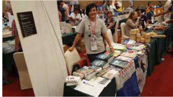
Ministerio de Familias de JuCUM en YWAM Together 2018