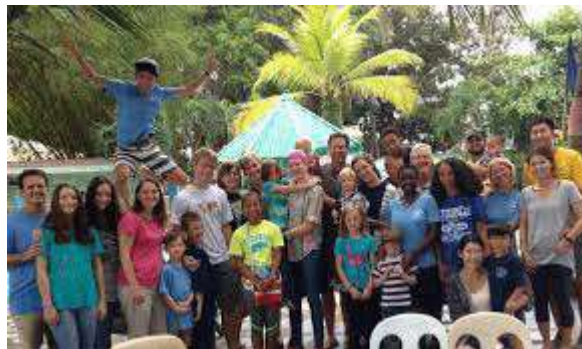
Valor Fundamental # 15 – Valora las familias

No te sorprendas si este ejercicio te hace derramar lagrimas o causa una profunda compasión por la persona con la que estas. Toma un momento para informar la actividad antes de seguir a la oración.