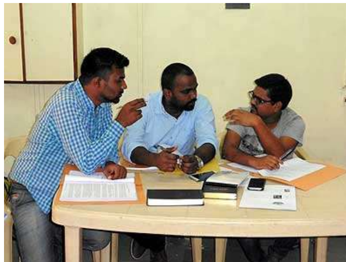
Hindues haciendo un estudio biblico en como levantar apoyo.

Si estas orando en grupo o si tienes mas tiempo para orar, puedes leer debajo la lista completa de sugerencias de oracion.