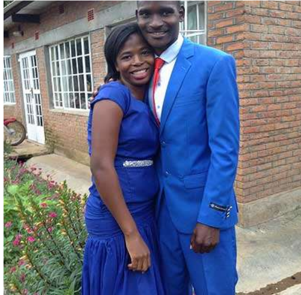
Jucumeros recién casados en Blantyre, Malawi.