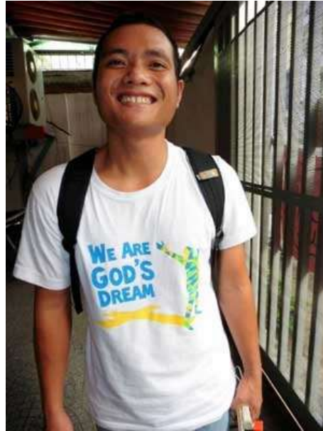
Un jucumero vietnamita.

Mientras preparabamos la informacion de oracion, hicimos una encuesta a varios jucumeros con ministerios en diferentes continentes para saber su opinion sobre retos actuals y lecciones aprendidas respecto al apoyo financiero. De estos encuestados, solo un muy pequeño porcentaje recibe apoyo de su iglesia local. Algunos dijeron que reciben apoyo de cristianos y no cristianos, y la mayoría dijo que amigos (muchos de ellos hechos durante los programas de entrenamiento de JuCUM) y familiares les ayudan. Algunos reportaron que hacen pequeños trabajos para conseguir dinero e incluso alguien dijo que solo el 10% de su apoyo es consistente cada mes pero que de todas maneras Dios siempre les provee lo necesario.