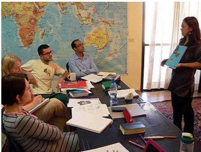
Jucumera de Indonesia compartiendo su vision.

Únete en oración a jucumeros alrededor del mundo para escuchar de Dios. ¡Él te está invitando!