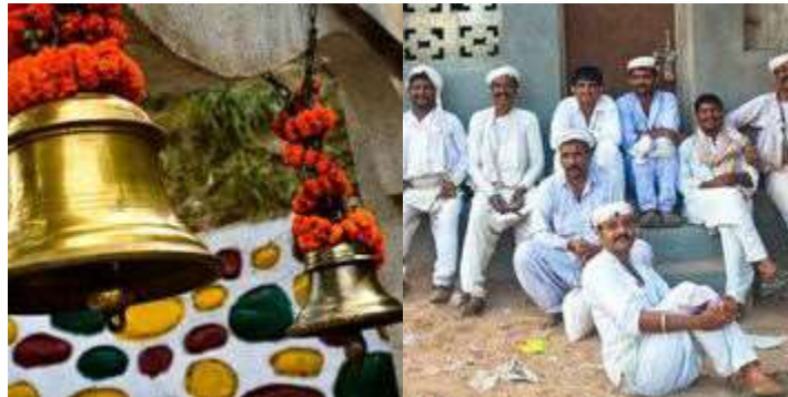
Créditos: Red de Amigos

Cuando todos han tomado un turno, pausa un momento en silencio. Antes de continuar con tu tiempo de oración, permite que los corazones sean suavizados y ensanchados con un sentido del anhelo profundo de Dios de bendecir a los hindúes.