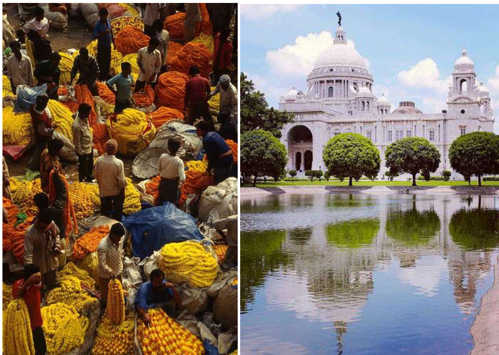
Feira de Calcutá, Memorial Victoria.

Junte-se a JOCUMeiros de todo o mundo em orar e ouvir de Deus. Ele está te convidando!