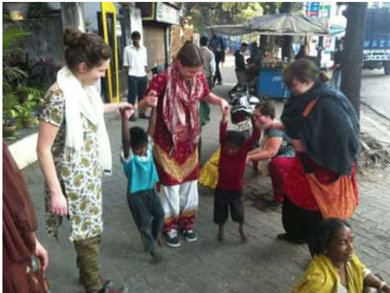
Alunos de ETED em Calcutá