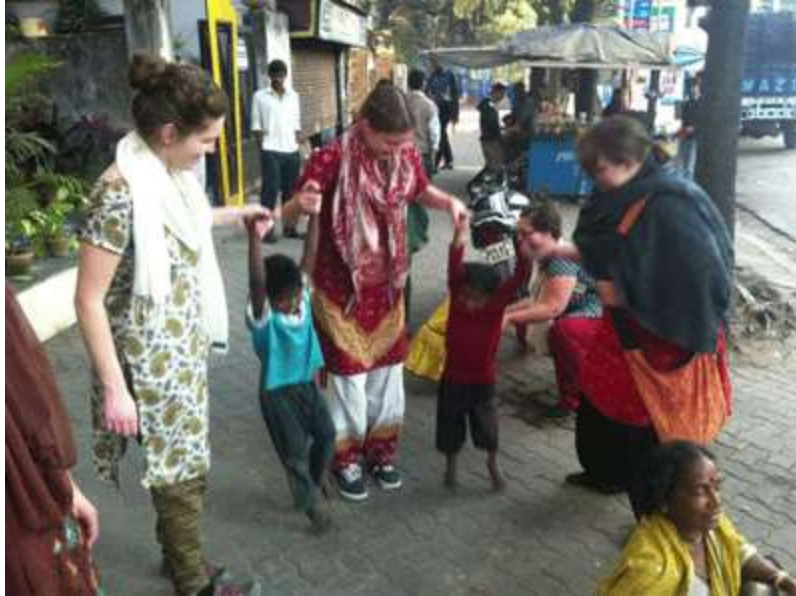
Estudiantes de EDE en Calcuta