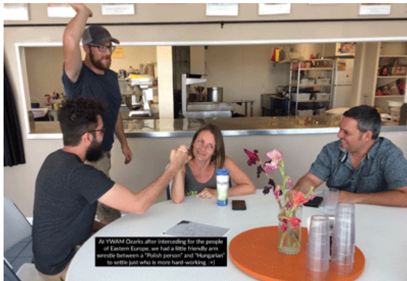
7 월 중부유럽을 위해 기도한 YWAM 오자크(Ozarks)