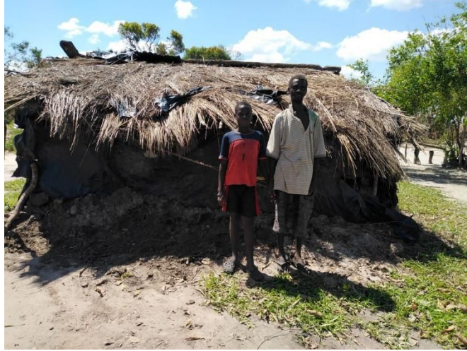
모잠비크의 재건을 위한 준비