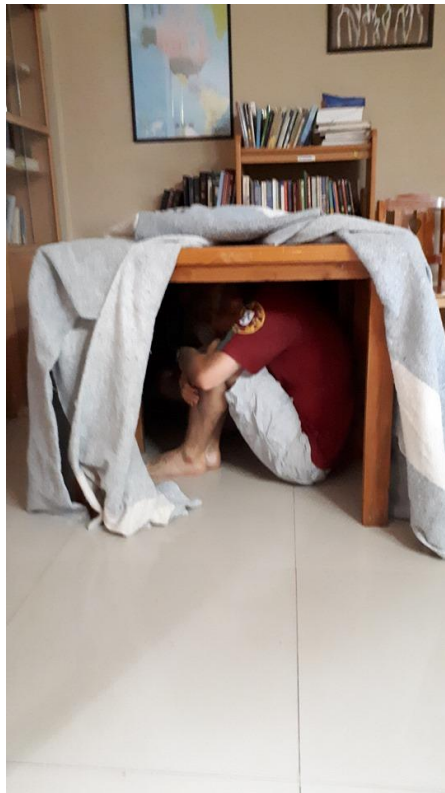
위구르족을 위한 기도 준비 사진 : YWAM 치앙라이(Chiang Rai, 태국)