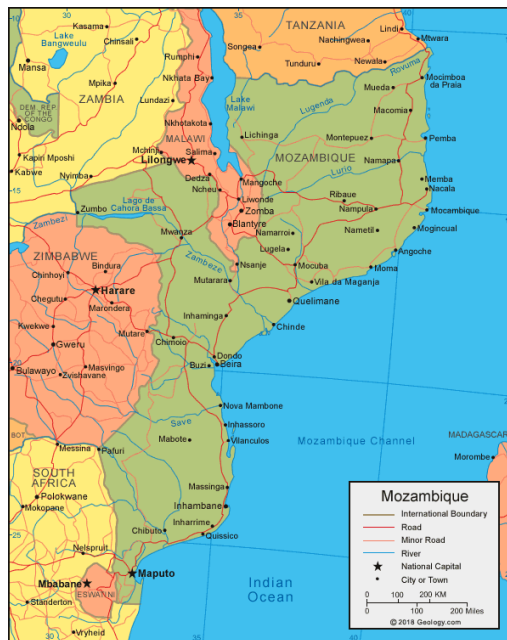
돈도와 베이라를 서쪽 해안에서 찾아보세요