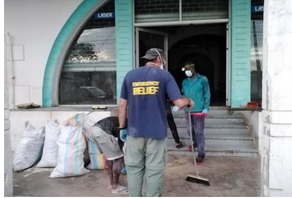
사이클론의 영향을 받은 모잠비크의 YWAM 베이스와 사역들