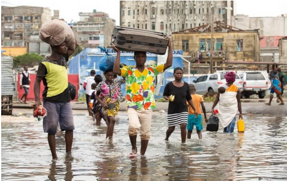
사이클론 이다이(Idai)가 지난 후의 모잠비크 베이라(Beira)

전세계에 있는 YWAMer들과 함께 하나님의 음성을 듣고 기도하는 일에 동참하세요. 하나님께서 당신을 초청하십니다!