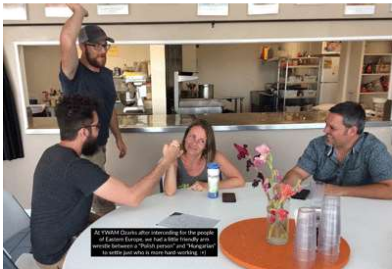
JuCUM Ozarks oro por Europa Central en julio