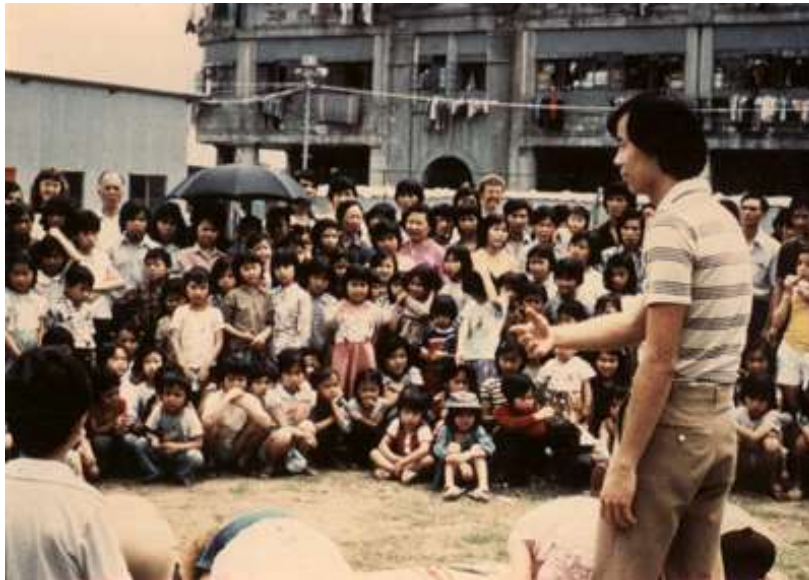
Equipe de Evangelismo do Extremo Oriente – Prático em Campo de Refugiados. Hong Kong, 1980.

Tome tempo para celebrar e estar cheio de gratidão pelo que Deus iniciou e fez passar durante estes últimos 60 anos.