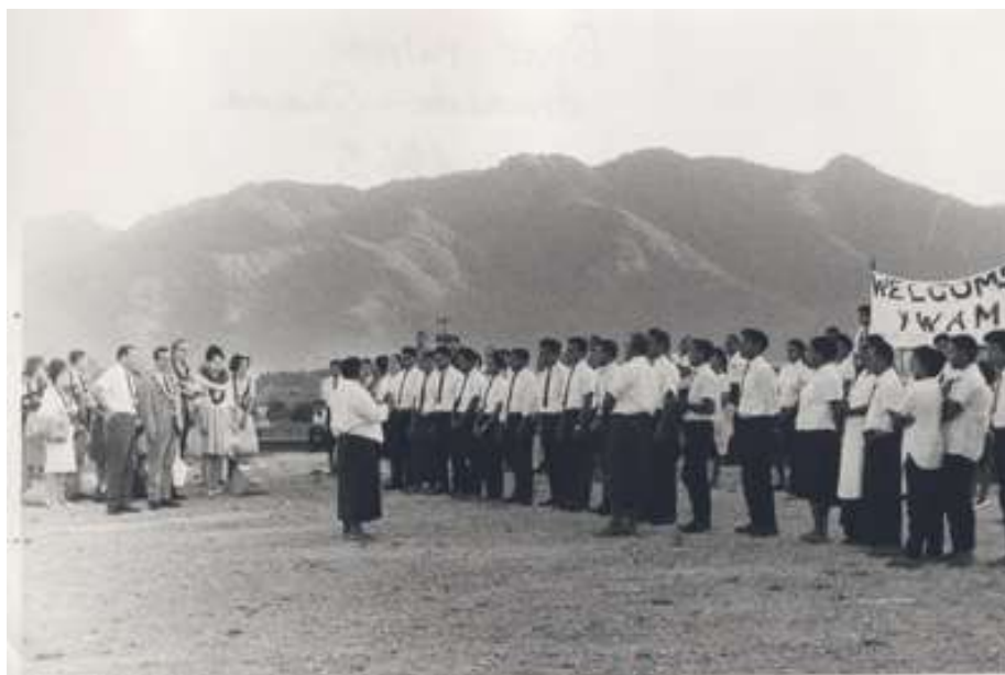
Primeiro prático da JOCUM – Samoa, 1965

Junte-se aos Jocumeiros de todo o mundo para orar e ouvir de Deus. Ele está te convidando!