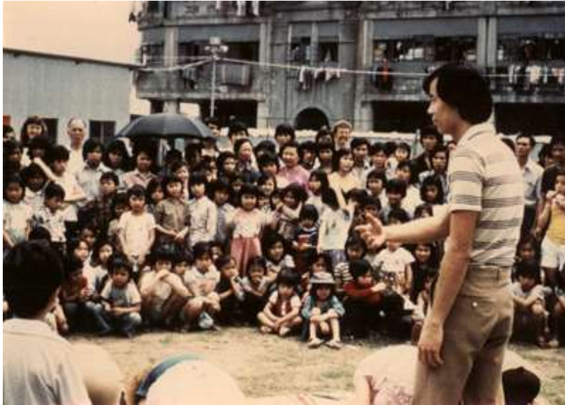
Tim Penginjilan Timur Jauh - Penjangkauan ke Kamp Pengungsi

Luangkan waktu untuk merayakan dan bersyukur atas apa yang telah Tuhan mulai dan wujudkan selama 60 tahun ini.