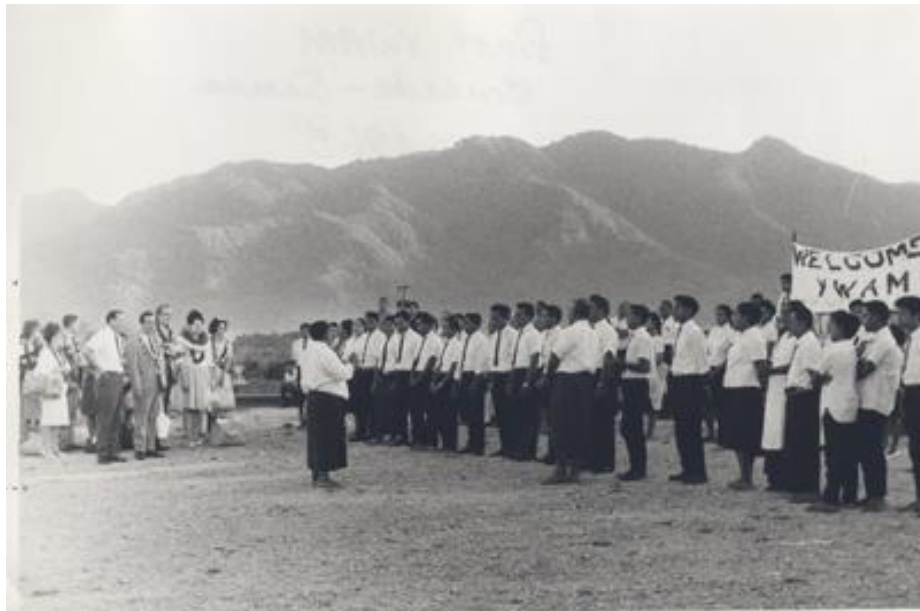
첫 번째 YWAM 전도 집회 (사모아, 1965)

전 세계의 YWAMer 들과 기도하며 하나님의 음성을 듣는 것에 함께 해 주십시오. 그분이 당신을 초대하고 계십니다!