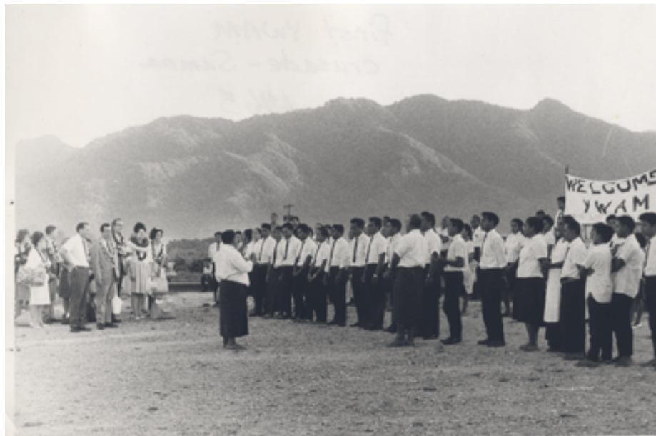
Première campagne de JEM – Samoa – 1965

Cette année marque le 60ème anniversaire de JEM, et nous désirons le célébrer. Joignez-vous à nous pour la journée de prière de l'invitation, le 8 octobre 2020.