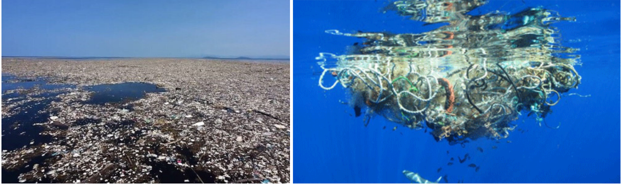
Zone de déchets de la taille du Texas, dans l'Atlantique Nord