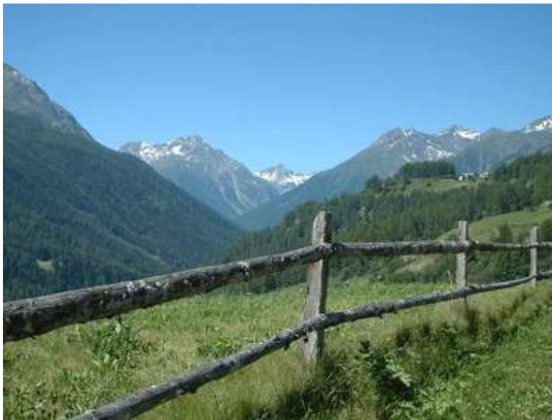
Care for Creation

Bete mit YWAMern rund um den Globus und höre auf Gott. Er lädt dich ein!!