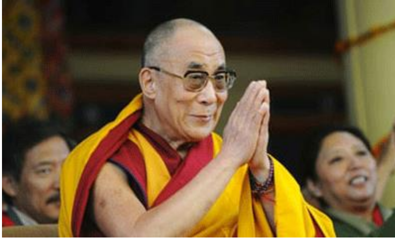
दलाई लामा।