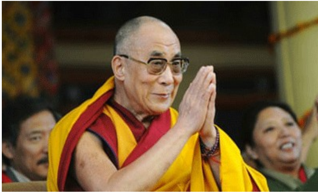
달라이 라마