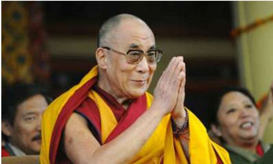
The Dalai Lama.